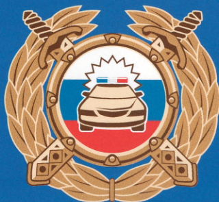
Госавтоинспекция МВД России

Буклет изготовлен по заказу Минпросвещения России в рамках реализации федеральной целевой программы «Повышение безопасности дорожного движения в 2013–2020 годах».