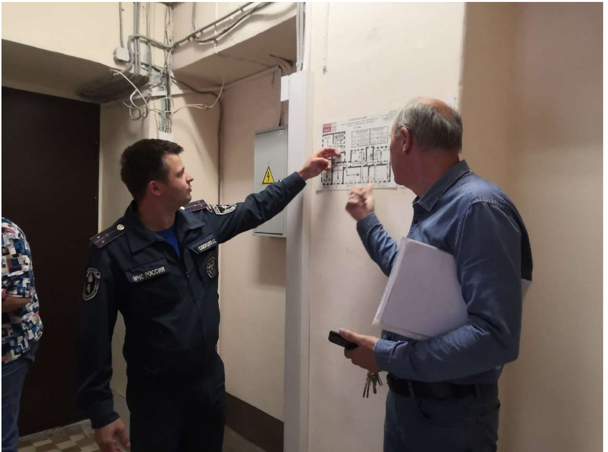
Управление по Центральному району 20.07.2020