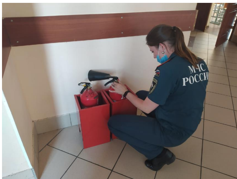
Управление по Центральному району Главного управления МЧС России по г. Санкт-Петербургу 16.06.2021