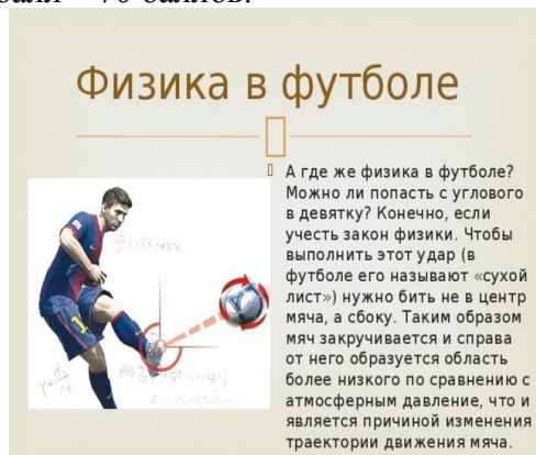
Проектный продукт-брошюра «Физика и спорт»

В защите приняли участие 48 обучающихся из 48. Сопровождали обучающихся при выполнении ИИП 13 педагогов. 30 (64%) проектов выполнены на высоком уровне, 17 (36%) выполнены на повышенном уровне, 1(2%) выполнен на базовом (удовлетворительном) уровне. 17 проектов получили наивысший балл – 70 баллов.