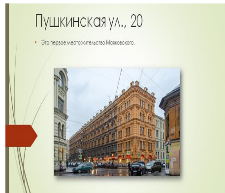
Проектный продукт «Петербург биографии и творчестве В.И Маяковского»

Были представлены следующие проектные продукты: