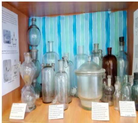
Проектный продукт- выставка «Химическая лабораторная посуда» ( с проведением экскурсий)